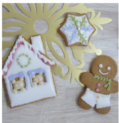
アイシングクッキー作り