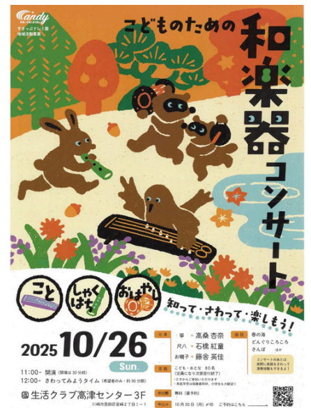
10月26日こどものための 和楽器コンサート

このほかにも、公園遊びの会やお下がり交換会、クリスマスコンサート、親子リトミック&ヨガ、離乳食講座、ベビーマッサージ、こども食堂など、親子で楽しめるワクワクいっぱいのイベントを開催！