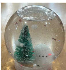
スノードームを作ろう